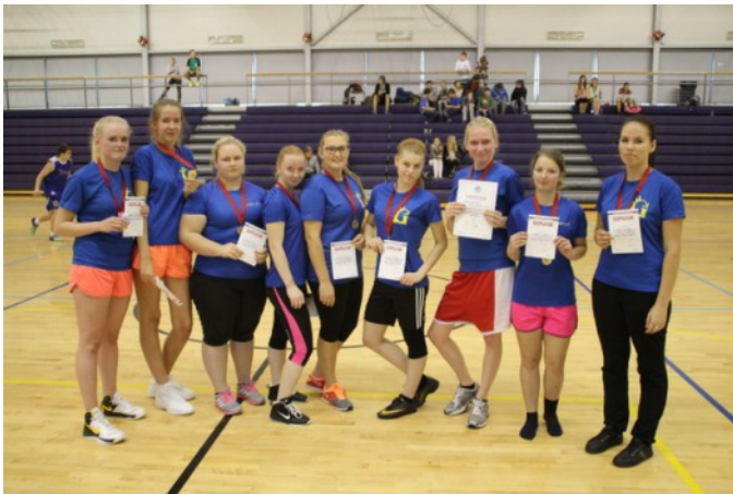
Noarootsi tüdrukute võistkond.

KAILI LEHT, SILVER SCHÖNBERG, kehalise kasvatusõpetajad: